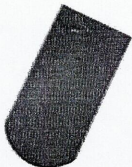
ȘIGLĂ SOLZ (ROTUNDĂ)