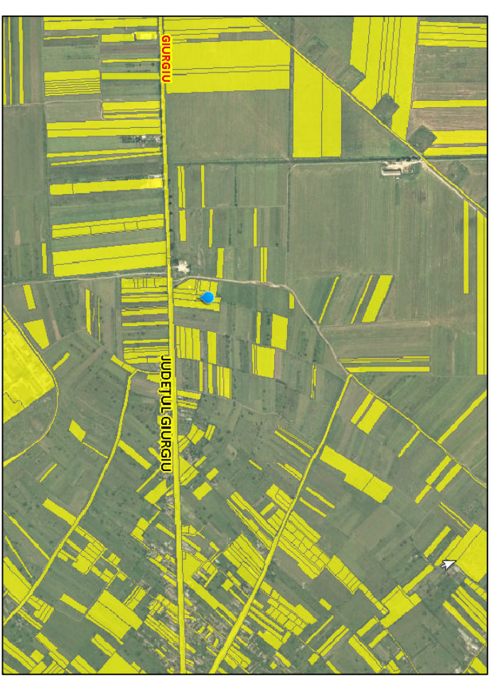
PROFIL DRUM PROPUȘ