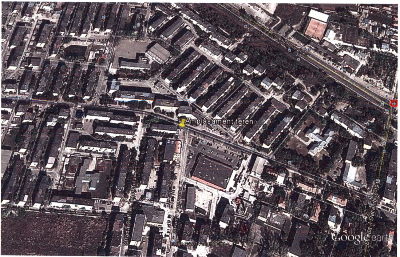
Amplasamentul aproximativ al terenului