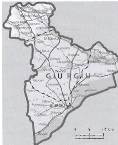
Fig. Zona de amplasament a zonei investigate

Accesul rutier este asigurat prin DN5 (E70, E85) București - Giurgiu - vama - Bulgaria; DN6 București - Alexandria - Craiova - Timisoara; DN61 Ghimpati - (A1) (DN7) Gaesti; DN5C Giurgiu - Zimnicea; DN58 Giurgiu - Ghimpati - (DN6 - Alexandria, București; DN61 - Gaesti); DN41 (Giurgiu)- Plopsoru-Oltenita.