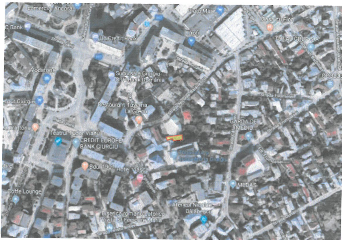
Terenul subiect al evaluarii situat in spatele Tribunalului si Judecatoriei Giurgiu.