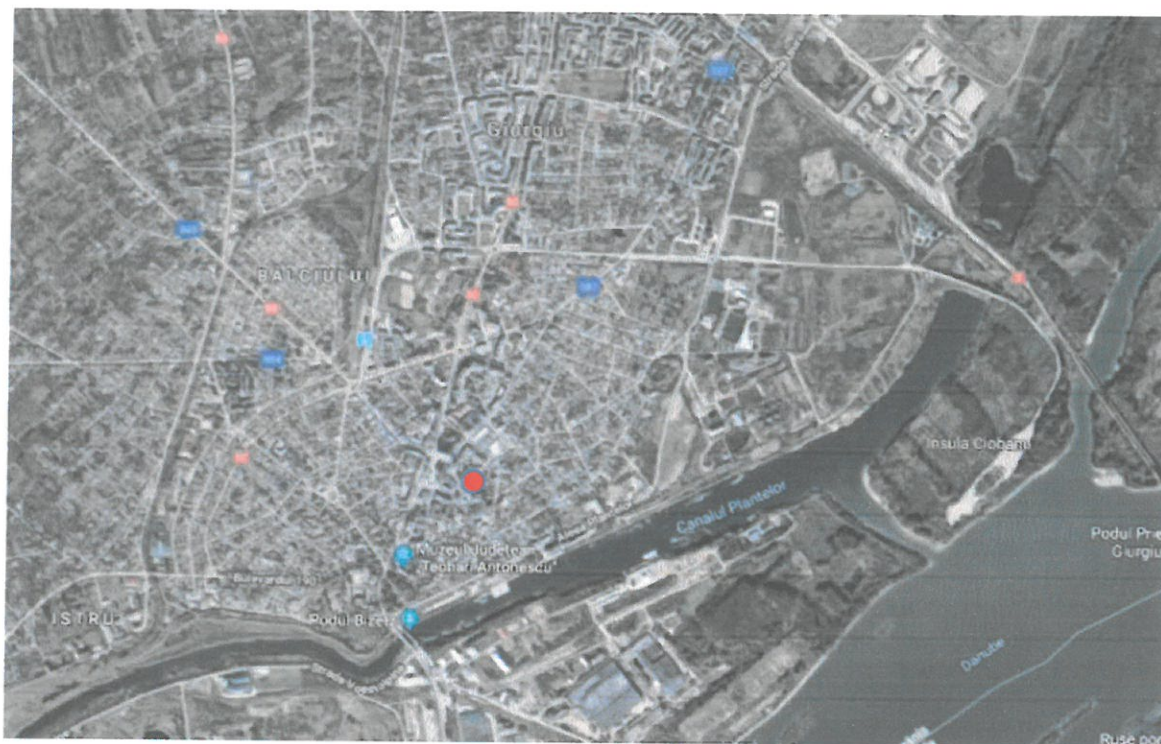
Localizarea proprietatii (teren pe strada Nicolae Balanescu nr 8) in partea centrala a Municipiului Giurgiu.

Economie Giurgiu: în economia județului Giurgiu se disting ca activități cu pondere semnificativă, agricultura, industria și comerțul. În cadrul industriei județului reprezentative sunt: industria alimentară, a băuturilor și tutunului, producția de energie electrică și termică, captarea, tratarea și distribuția apei, extracția petrolului și gazelor naturale, industria textilă și a confecțiilor din textile. În anul 1996 a luat ființă Regia autonomă "Zona Liberă" Giurgiu amplasată în partea de sud-est a municipiului Giurgiu, pe o suprafață de 163.54 ha, care s-a transformat începând cu 01.06.2004 în societate comercială pe acțiuni.