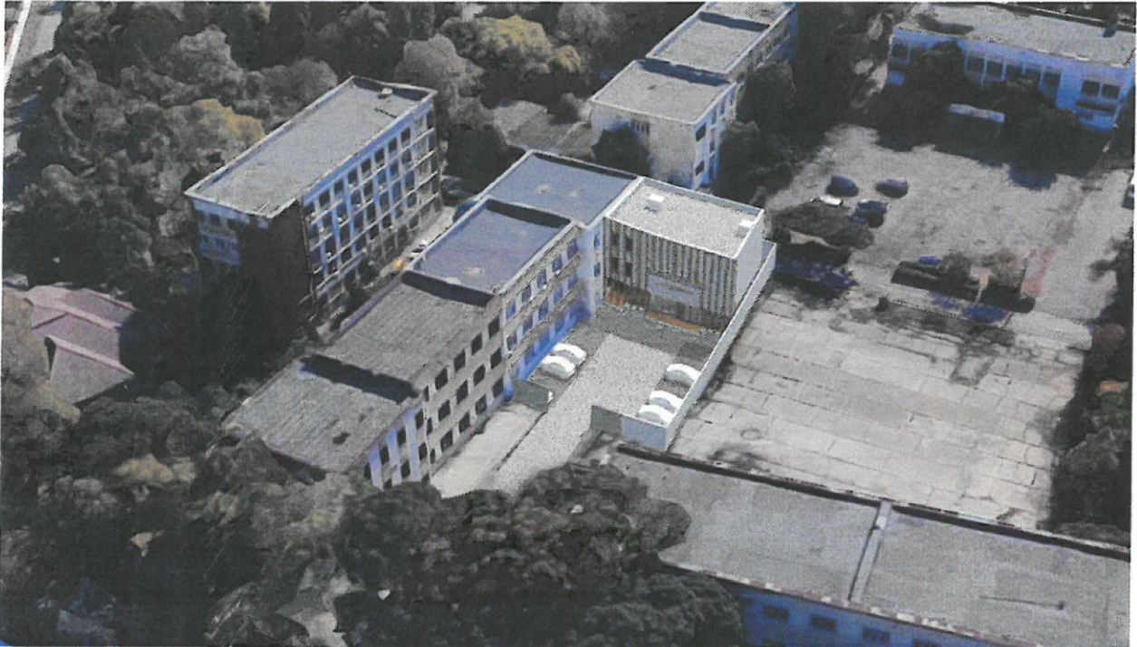
Figura 3 – Incadrarea construcției propuse în contextul urbanistic actual